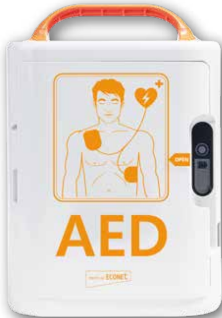
ECOPAD - Der kosteneffektivste AED. ECOPAD - The most cost-effective AED.