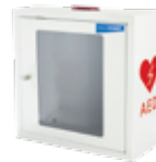
Wandkasten mit Alarm für AED Wall cabinet with alarm for AED