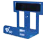
Wall mount for AED Wandhalterung für AED